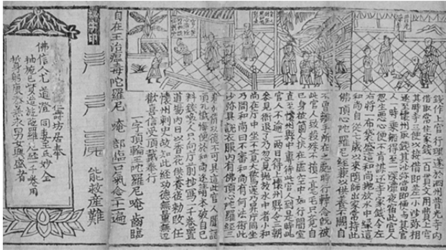
圖 12、元《佛頂心大陀羅尼經》(部分) 浙江博物館