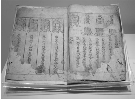
圖 9、北斗七星供養文 朝鮮時代 韓國國立中央圖書館藏

熾盛光如來，智慧不思議。悉知一切衆生心，能以種種方便力，滅彼群生無量苦。……[中略]特爲己身，消滅千災，成就萬福，無病長生，子孫昌盛之願。以今月某日，盥手焚香，虔誠禮請，消災降福。」 32 可知七星閣除了祈求子孫昌盛以外，還有消災、延命、治病等功能。