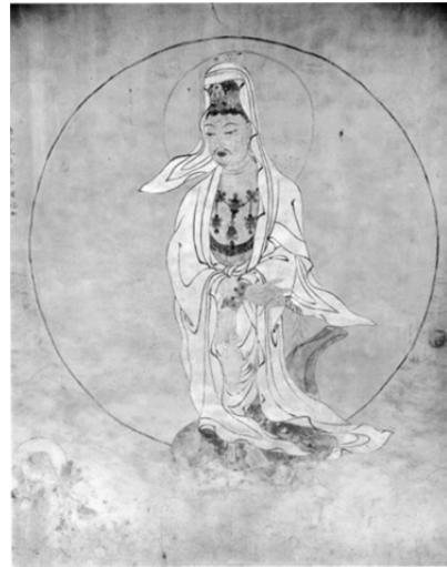
圖 6、無為寺極樂寶殿白衣觀音圖 寶物第 1314 土壁著色 朝鮮 1476 年 320×280cm 全羅南道康津郡