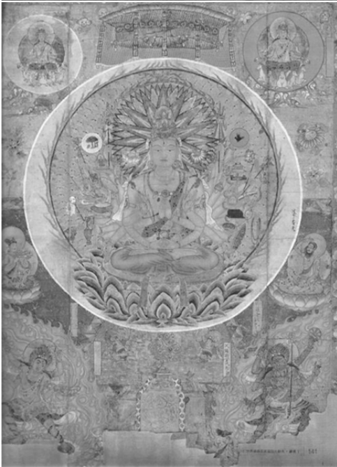
圖 17、千手千眼觀音菩薩圖 晚唐 莫高窟第 17 窟出土 絹本著色 165.0×125.3cm 印度新德里國家博物館藏