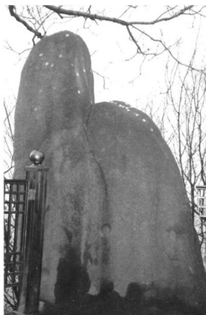
圖 11、祈子石（男根石）年代不詳 京畿道安養市三幕寺