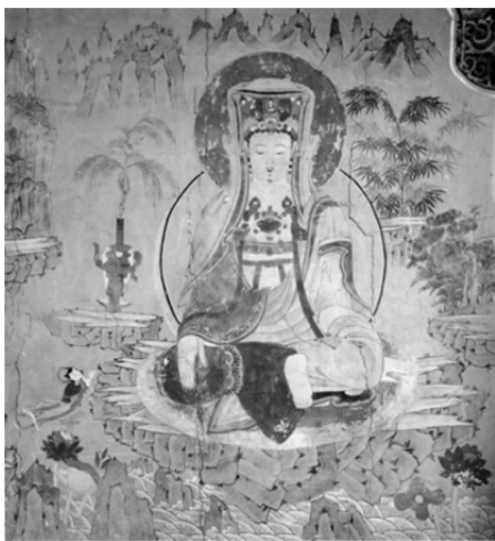
圖 1、雲門寺毘盧殿 水月觀音圖 壁畫 寶物第 1817 朝鮮時代 慶尚北道 清道郡

筆者注意白衣觀音與熾盛光佛之間的關聯性，起自於發現韓國送子觀音圖的不發達。佛教繪畫中與祈子、育子有關的題材有九子母、訶利帝母(ŚHārīti, 又稱鬼子母)、送子觀音等。其中在中國最為人所熟悉，受到大眾崇拜的應就是送子觀音。韓國觀音佛畫始自三國時代，但已無遺存。現有為高麗和朝鮮時期所作。高麗時期以絹本著色的〈水月觀音圖〉為主，同時期流行於中國江浙一帶以水墨表現的禪宗繪畫〈白衣觀音圖〉，在此並未受到青睞。朝鮮時期以佛寺壁畫和觀音幀畫為主(圖 1, 2)。圖象主要沿襲高麗晚期〈水月觀音圖〉樣式，或與《佛頂心大陀羅尼經》、《千手神妙章句大陀羅尼經》等陀羅尼經所附卷首畫及插圖相互緊密連繫。 1 中世紀後期以後在中國流行的〈送子觀音圖〉在此不多見。