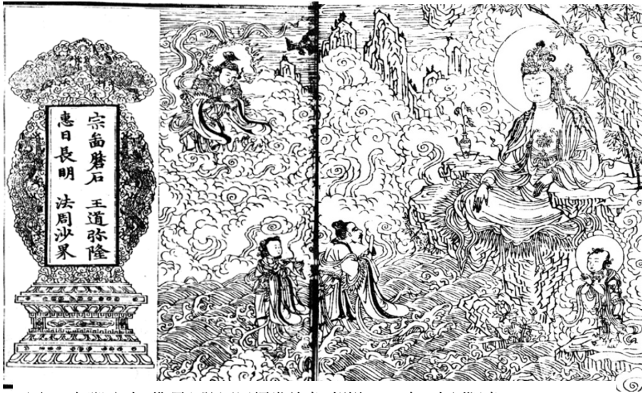
圖 4、解脫庵本 佛頂心陀羅尼經卷首畫 朝鮮 1561 年 木刻版畫 20.3×14.9cm 延世大學學術情報院藏