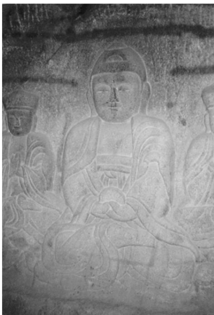
圖 10、磨崖熾盛光如來三尊佛像（局部）朝鮮 1763 年 京畿道安養市三幕寺七星閣