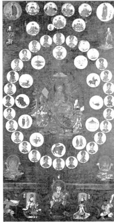
圖 20、星曼荼羅 鎌倉時代 絹本 著色 102.2×61.3cm 大阪高倉寺 寶積院藏