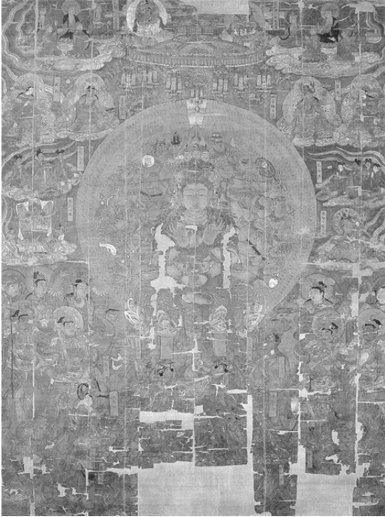
圖 15、千手千眼觀音菩薩圖 唐 9 世紀 莫高窟第 17 窟出土 絹本著色 222.5x167.0cm 大英博物館藏