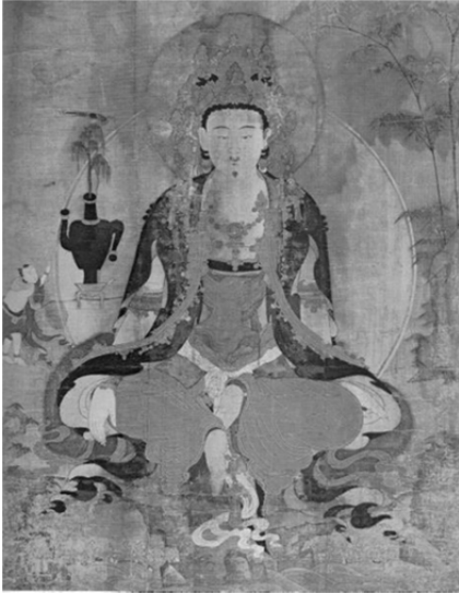
圖 2、義謙等筆 水月觀音圖 寶物第 1204 朝鮮 1730 年 絹本著色 104x142cm

自古以來，生子為人生儀禮重要大事。人們藉由宗教祈禱或各種方法來滿足求嗣心願。依民俗學界採用的研究方法論，韓國祈子方式分為兩種類型，一是至誠祈子，一是咒術祈子。 2 至誠祈子是當事者或親人向自然崇拜物或神祇虔誠禱告。咒術祈子是以配帶物品、咒語或攝取飲食的方法，藉由咒術的力量達成願望。至誠祈子中受到崇拜的神祇非常多，自然界有山神、龍神、水神、天神、北斗七星，或融攝精靈崇拜與民俗信仰的男根石、七星石等。家中有護佑家族平安的城主神、產神。其中，民間最為常用影響也最大的是佛教的觀音、熾盛光佛或彌勒佛。一般是前往佛寺大雄殿，或七星堂、山神閣布施佛供或百日祈禱。 3 可以說觀音