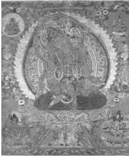
圖 18、如意輪觀音菩薩圖 莫高窟第 17 窟出土 五代 絹本著色 71.5×60.7cm 法吉美博物館藏