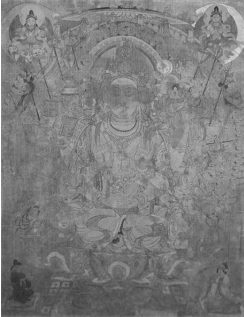
圖 16、千手千眼觀音菩薩圖 唐 8—9 世紀 莫高窟第 17 窟出土 絹本著色 79.3×62.0cm 大英博物館藏