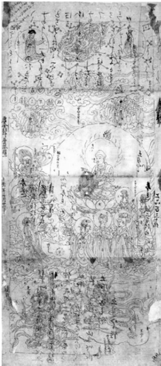
圖 19、唐北斗曼荼羅圖 1148 年 紙本墨畫 111.5×51.5cm 東京藝術大學 大學美術館藏