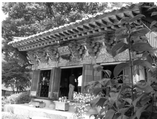
圖 7、奉元寺七星閣 首爾西大門區奉元洞

星以佛教七星如來和道教七元星君兩種圖象表現來看， 30 具有濃厚的道教色彩以及在地化的面貌。