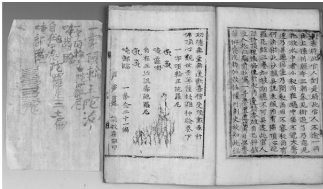
圖 13、朝鮮 1642 年《佛頂心大陀羅尼經》直指寺聖寶博物館

現韓國立中央博物館藏高麗小字本《佛頂心觀世音菩薩大陀羅尼經》，將經文抄寫在長 27.5 公分，寬 5.3 公分紙上，摺疊放入金銀製小盒。卷尾亦書有「一字頂輪王陀羅尼」和「唵部臨」。依發願文可知是為高麗武人時期執權者崔忠獻（1149—1219）父子三人消災祈福，作為護身用的小字本。 60 由此看來，一字佛頂輪王圖象雖在九世紀以後消失，由熾盛光佛所取代， 61 但此陀羅尼仍然與某些特定的陀羅尼一同流通，