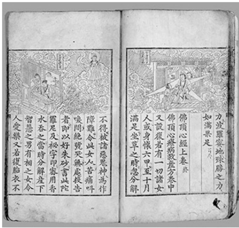
圖 3、佛頂心陀羅尼經 湖林博物館藏 寶物第 1108 朝鮮 1485 年 31.0x18.7cm

觀音靈驗記中所述祈子方法，比陀羅尼經更世俗功利化。如虔誦、禮懺、印經流通、捐金建寺等。所錄祈子感應故事取自中國，人物地點多未加修改。如《四經持驗錄》所錄「唐衡陽士人，年高無子，祈嗣靡所不至。忽遇老僧持白衣觀音經，授之曰：佛說此經，有能授持，隨心所願。獲福無量。若欲求子，卽生慧智之男，有白衣重包之異。於是夫