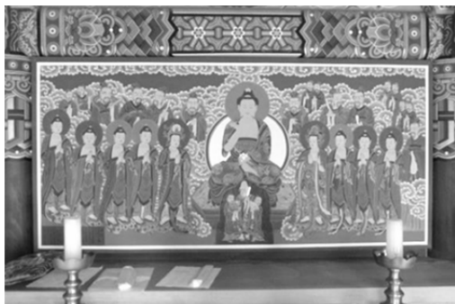
圖 8、熾盛光如來圖和佛桌上白色的長命縷 忠清南道扶餘郡無量寺三聖閣

朝鮮佛教的七星信仰有「七星佛供」和「七星祈禱」。七星佛供是信徒布施祭品，由僧侶進行祈福消災的儀式。七星祈禱是在特定的時間內，迎奉七星至尊佛進行拜禱。發心的信徒可親自參加或由僧侶代替，一般在陰曆正月七日、七月七日。 31 依七星佛供〈七星請文〉云：「仰惟