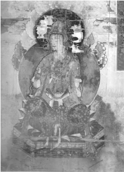
圖 14、把溪寺二應庵 南無消災菩薩 朝鮮 1717 年 絹本著色 73.0x50.5cm

那麼，在觀音身旁的日光菩薩、月光菩薩其職責為何？經云：「是時當有日光菩薩、月光菩薩與無量神仙，來為作證，益其效驗。我時當以千眼照見，千手護持。從是以往，所有世間經書，悉能受持；一切外道法術、韋陀典籍，亦能通達。誦持此神呪者，世間八萬四千種病，悉皆治之，無不差者。」 64 可知日光菩薩、月光菩薩的職能是增益持咒的效驗，功能與作為熾盛光佛脇侍可說是異曲同工。