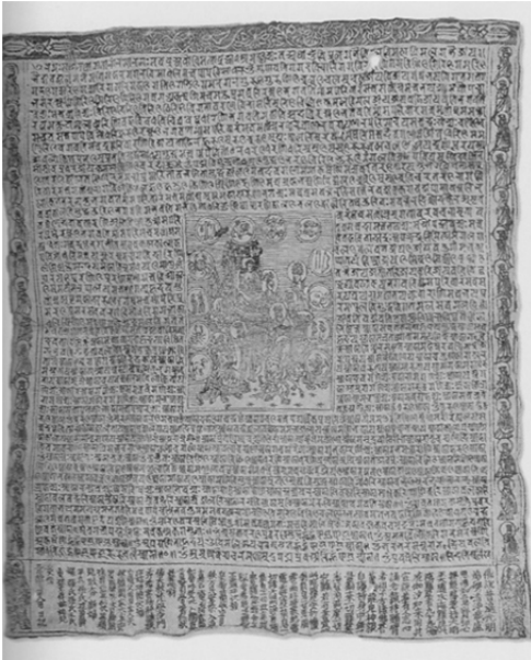
圖 21、蘇州瑞光寺塔出土 梵文大隨求陀羅尼經咒圖 北宋 1005 年 紙本版畫 25.0×21.2cm

者等同如「一切如來熾盛光明身」。解讀以上經說，可知當帝王受持此大隨求陀羅尼時，身即變為轉輪王，可是熾盛光佛，亦可是觀音。以兩者都為轉輪王，同身同尊格來看，或可解釋北宋景德二年〈大隨求陀羅尼曼荼羅〉中何以出現熾盛光佛的原因。