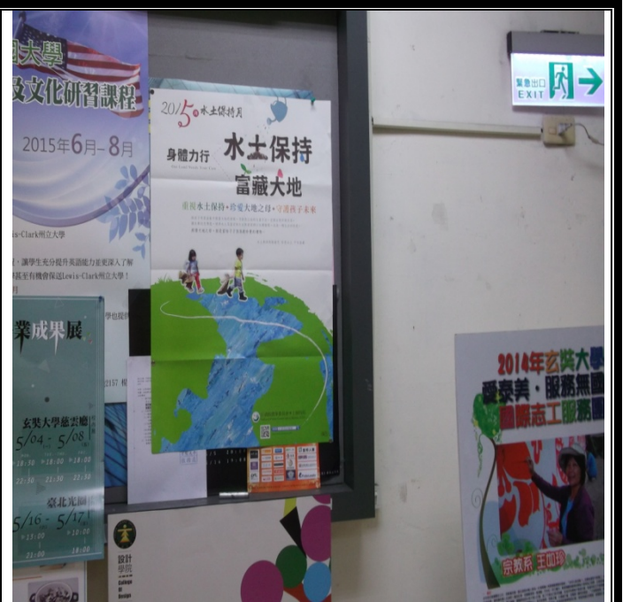
圖資大樓張貼宣導海報照片-6