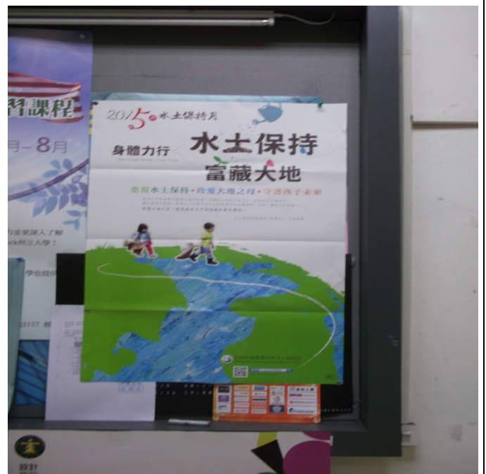
圖資大樓張貼宣導海報照片-4