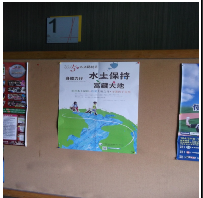
善導活動中心張貼宣導海報照片-8