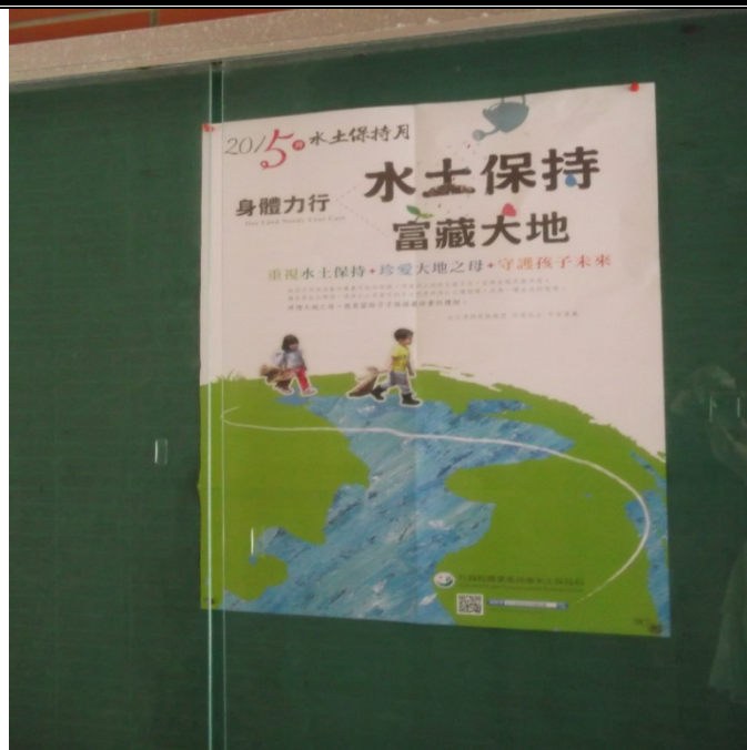
廣欽張貼宣導海報照片-13