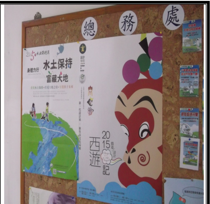
總務處張貼宣導海報照片-2