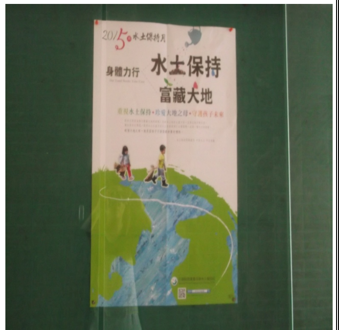
廣欽張貼宣導海報照片-12