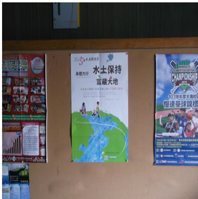
善導活動中心張貼宣導海報照片-7