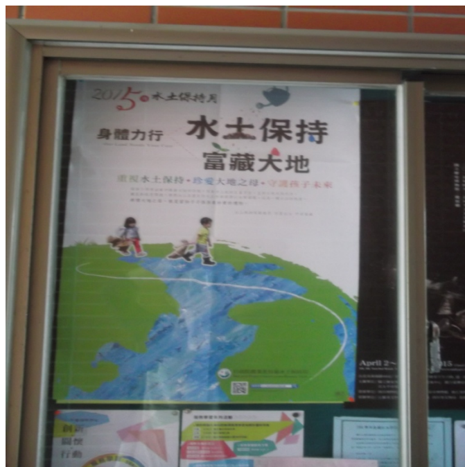
妙然大樓張貼宣導海報照片-11