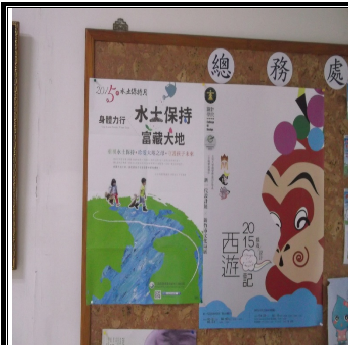
總務處張貼宣導海報照片-1