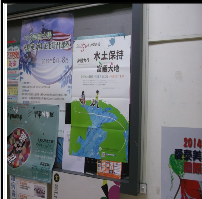
圖資大樓張貼宣導海報照片-5