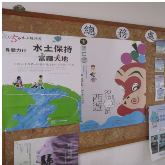
總務處張貼宣導海報照片-3