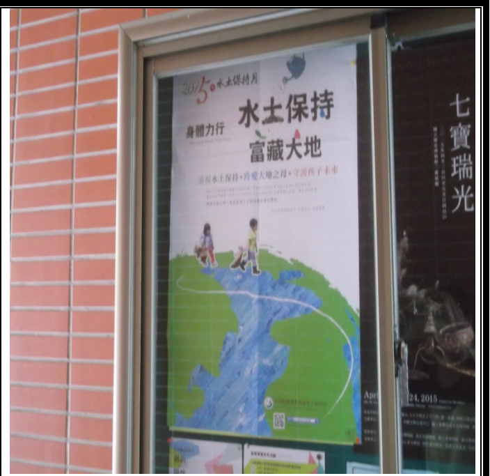
妙然大樓張貼宣導海報照片-10