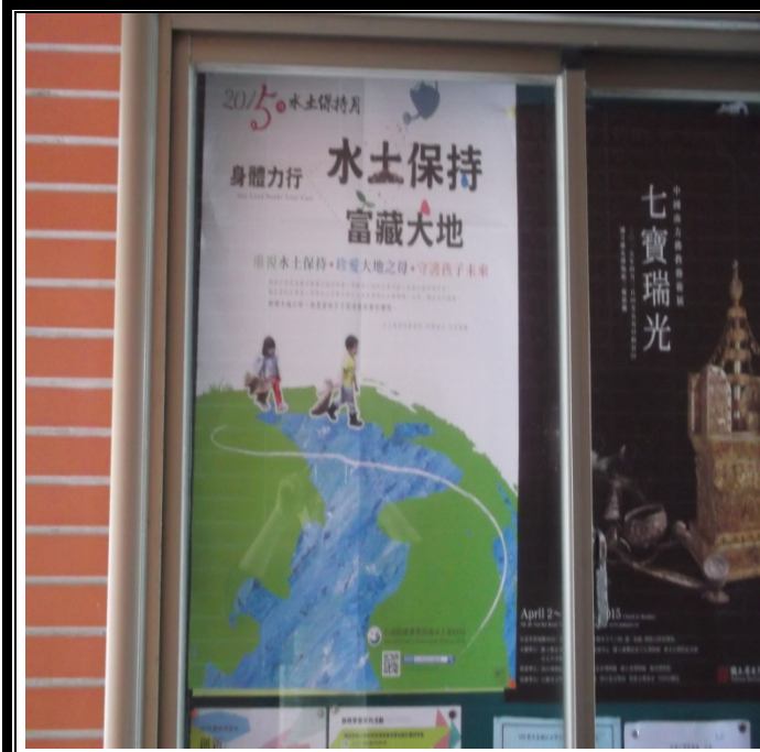
妙然大樓張貼宣導海報照片-9